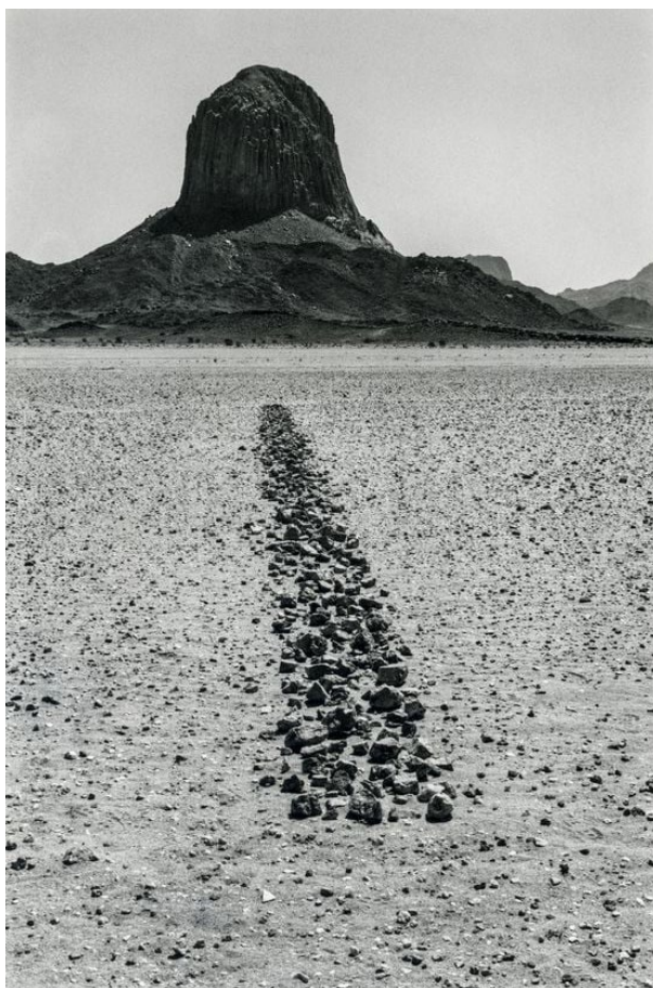
RICHARD LONG> Line in Sahara – 1988

*Mesure de longueur, espace maximum entre l'extrémité du pouce et du petit doigt de la main ouverte.