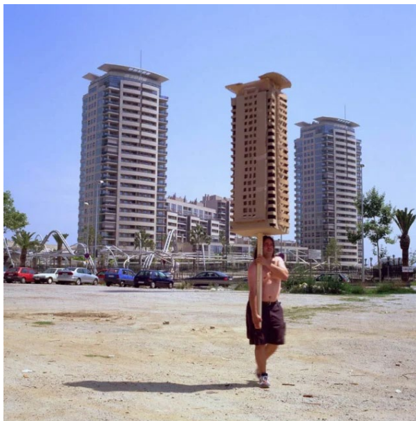
JORDI COLOMER > Anarchitekton Barcelona (Torre Agbar), 2004

Inventorier des empan*, l'utilisation des différentes parties du corps comme outil de mesure - pouce/auriculaire, poing, avant bras, pieds, pas, corps entier, envergure des bras, des jambes, etc etc.